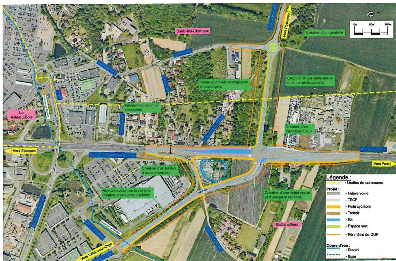
Plan des travaux